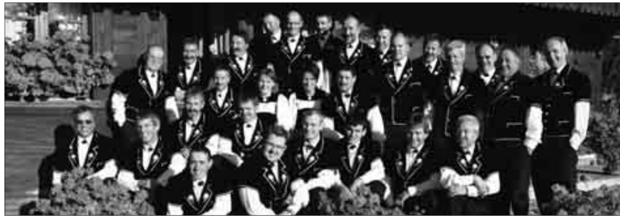
Am 20. Mai lädt das Jodlerchörli Eriswil zur Taufe seiner neuen CD ein.